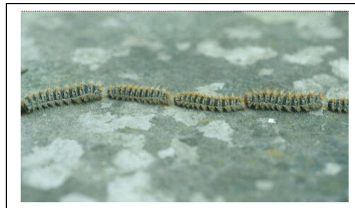
"processione" delle larve (avviene in marzo – maggio)

La processionaria del pino è un insetto che nella fase larvale è piuttosto dannoso per l'uomo e gli animali domestici, in quanto presenta sul corpo ciuffi di peli urticanti che provocano irritazioni cutanee, degli occhi e delle vie respiratorie. I nidi sono inconfondibili: si tratta di un bozzolo di colore bianco (in autunno - inverno) e marrone (negli altri periodi), posizionato alle estremità dei rami (preferibilmente esposti verso sud), con dimensioni variabili da 10 a 20 cm.