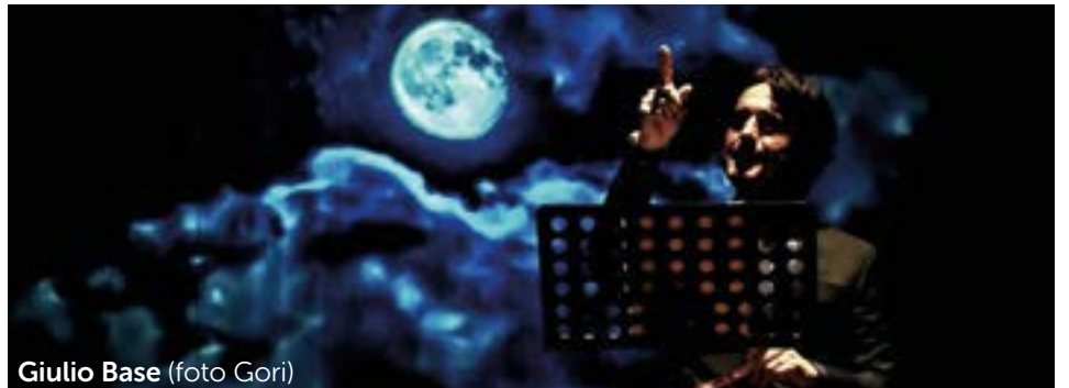
Giulio Base