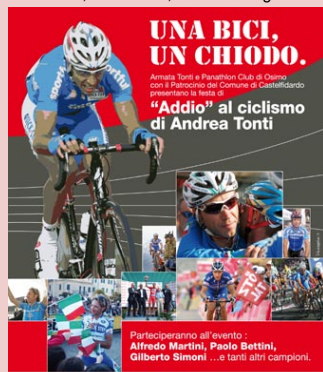
SABATO 12 MARZO 2011 TEATRO ASTRA DI CASTELFIDARDO ORE 16.30 INGRESSO LIBERO