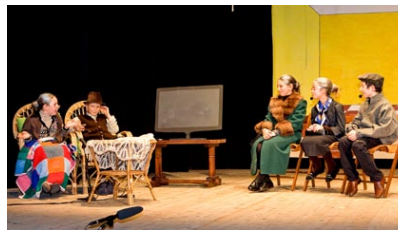
Gli alunni della classe V di Cerretano