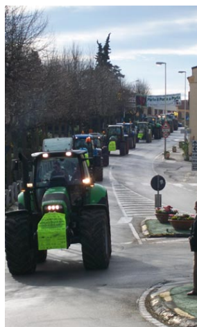
festosa sfilata dei mezzi agricoli lungo il centro storico: oltre 40 i "trattoristi" presenti, che hanno poi seguito la Santa Messa e ricevuto la benedizione. Nella foto sopra la tradizionale sfilata dei mezzi agricoli per le vie del centro storico di Castelfidardo. Nella foto a sinistra un momento del convegno.