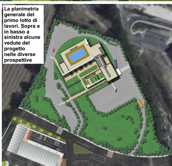
La planimetria generale del primo lotto di lavori. Sopra e in basso a sinistra alcune vedute del progetto nelle diverse prospettive

quindi che la vegetazione funge da "fondale" a tutti i momenti vissuti all'interno della scuola. Tale intenzione è evidente soprattutto nell'atrio dove lo spazio, a tutt'altezza, si proietta verso la corte attrezzata esterna creando un unicum spaziale, una superficie libera da destinarsi a scopi didattici e ricreativi. Al piano terra troveranno collocazione nove aule "normali", due "speciali" (educazione artistica e laboratorio scientifico), oltre alla sala professori con relativo archivio, i servizi, il locale impiantistico, la presidenza, tre uffici segreteria e la sala per il personale non docente. Al primo piano, sei aule normali, due speciali (educazione musicale e informatica), la biblioteca, i servizi, l'archivio, uno spazio comune, una seconda "bidelleria" ed un ambiente polifunzionale per conferenze e riunioni. Tale spazio potrà essere utilizzato, al di fuori dell'orario scolastico, da associazioni e comitati, avendo garantita una propria autonomia funzionale con servizi e accesso indipendente. Nello stesso piano è prevista la realizzazione di un tetto-giardino dove gli alunni potranno svolgere attività legate alla conoscenza dell'orti e floricoltura. Nel piano copertura, sono localizzate le macchine impiantistiche ma anche uno spazio attrezzato per lo sport con dimensioni regolamentari di un campo da pallavolo. Sul prolungamento dell'asse di accesso alla scuola è posizionata la rampa che condurrà alla palestra di futura realizzazione in colla-